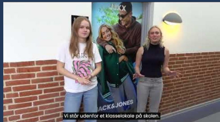
Vi står udenfor et klasselokale på skolen.

Elevernes udvikling dokumenteres i deres individuelle karriereplaner, som afspejler deres faglige stolthed og forbereder dem til at blive værdifulde medarbejdere. Vores undervisere er engagerede og højt kvalificerede, og vi vægter undervisningsmiljøet højt i samarbejde med elevrådet for at sikre elevernes motivation og fastholdelse. Se mere om skolens læringsmiljø og elevrådets arbejde . Se også videoen nedenfor og/eller besøg vores hjemmeside for yderligere information: learnmark.dk/business .